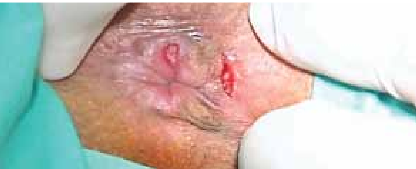
Botox ile tedavi

... gibi çağdaş yaklaşımlardan ilmi zeminde gerekli ve uygun bir ya da birkaçına karar verilecek ve sizinle ayrıntılı olarak tartışılacaktır.